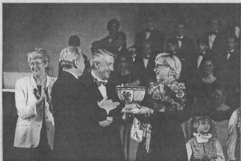
Сразу стоит отметить, что выступление сургутских юных дарований москвичам пришлось по душе.

В ближайшем номере «СТ» будет опубликован материал, где мы подробно расскажем о том, как сургутяне блистали на московской сцене.