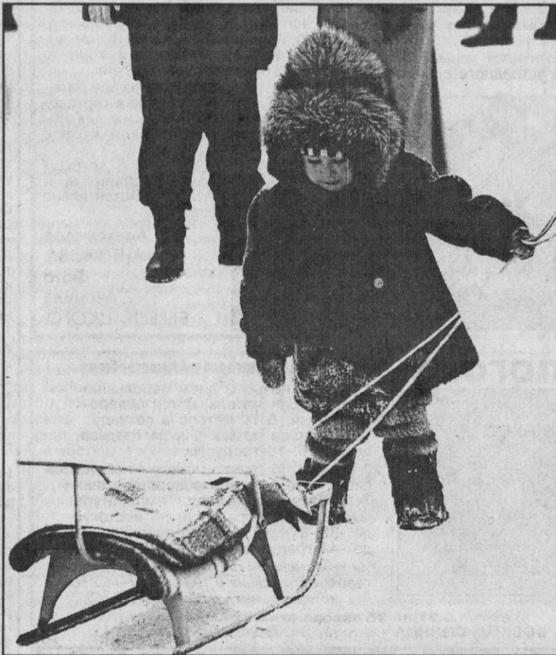
«И почему эти сани такие упрямые...».