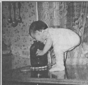
«Жаль, не мой размер...»