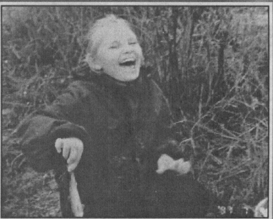
«Смех, а не рыба»

Мы напоминаем читателям-фотолюбителям, профессионалам и просто берущим в руки фотоаппарат от случая к случаю, что рубрика «Сам себе фотограф» ждет ваши подсмотренные и «поставленные», грустные и веселые снимки. Особо удачные из них будут опубликованы, а самые лучшие ожидают ценные призы. Приносите или присылайте в редакцию «СТ» ваши фотосюжеты. Их должны видеть все!