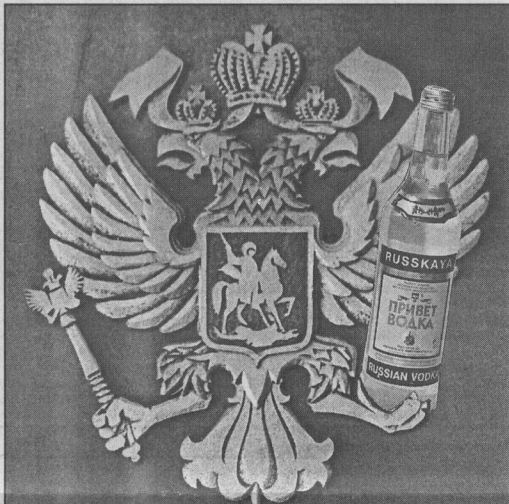
Коллаж Леонида Березницкого.

Скептически настроенные эксперты утверждают, что решение правительства об введении с 1 октября госмонополии на производство пищевого спирта и оптовый оборот ликероводоч-