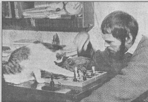
«Шах и мат от Музрика».

Конечно, в морозные вечера приятно бывает завернуться в плед и с чашечкой чая застыть перед телевизором. Однако тем, кто не ленив душой, такое времяпровождение может показаться скучным, и тогда уже никакие плюсы холода не помешают отправиться на поиск новых впечатлений, интересных знакомств и незабываемых приключений.