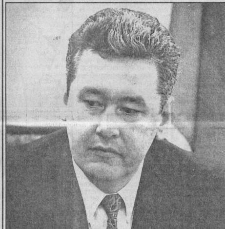
У студентов есть такое понятие, как «экватор». Означает оно то, что ровно половина пути уже позади, и теперь необходимо учесть все пройденное и набраться сил, дабы одолеть и вторую половину. Именно в такой ситуации сейчас находятся депутаты Думы Ханты-Мансийского автономного округа. Побывавший на этой неделе в Сургуте председатель Думы ХМАО Сергей Собянин, подводя итоги половины своего выборного срока, убежденно произнес: «Эти два года мы провели в Думе не зря».

тью по разработке региональных законов и, на что в данном случае надо обратить внимание, поправкам к федеральным законам. Так что «есть все возможности - и профессиональные, и политические, чтобы эффективно заниматься этим на федеральном уровне».