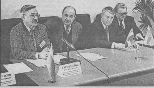
Очередная официальная делегация посетила наш город на этой неделе в надежде завязать с нами добрые отношения, построенные на «реальных хозяйственных связях».

На этот раз гости прибыли из суверенной республики Башкортостан. Оказались они здесь не впервые - уже действует соглашение субъектов Федерации (республики и ХМАО) о сотрудничестве в культуре, а теперь вот подошло время поговорить и о темах более, так сказать, материальных.