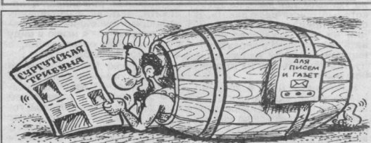
Рисунок Александра МАРКЕЛОВА.

масло подсолнечное «Йдеаль», «Олеолюкс», «Масленец»; минеральную воду в ассортименте; маргарин - 5.50; майонез отечества - 5.00; муку в/с - 2.90.