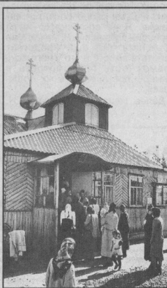
состоится божественная литургия.

24 и 25 мая без осадков, ветер юго-восточный, 7-12 метров в секунду. Температура ночью +7-12 градусов, днем +21-26 градусов. ВОСХОД СОЛНЦА 24 мая - 5.06; 25-го - 5.04; 26-го - 5.03.