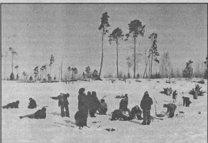
Небывалое скопление рыбаков можно было наблюдать в дни майских праздников в районе Солнkinского месторождения, что в девяносто километрах от города.