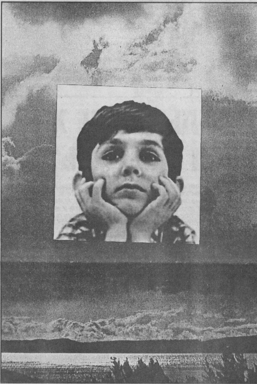
Коллаж Леонида БЕРЕЗНИЦКОГО.