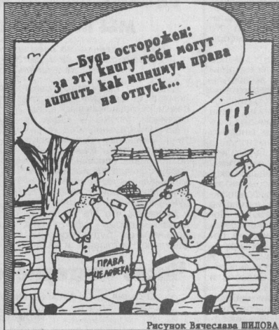
Рисунок Вячеслава ЧУДНОВА