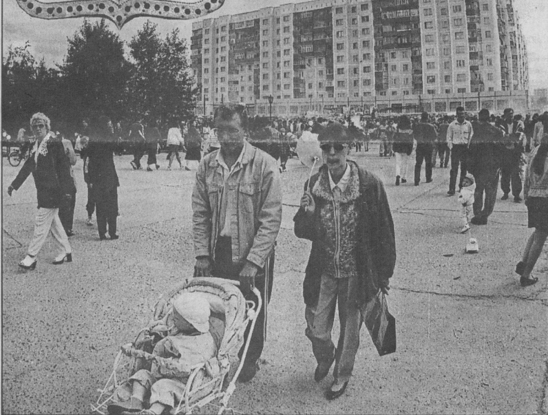
Коллаж Леонида БЕРЕЗНИЦКОГО.