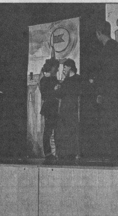
Вряд ли кто-то из студийцев - учащихся 56-го профиля до недавнего времени знал о Норт-

На снимках: сцена из спектакля; похвальная грамота.