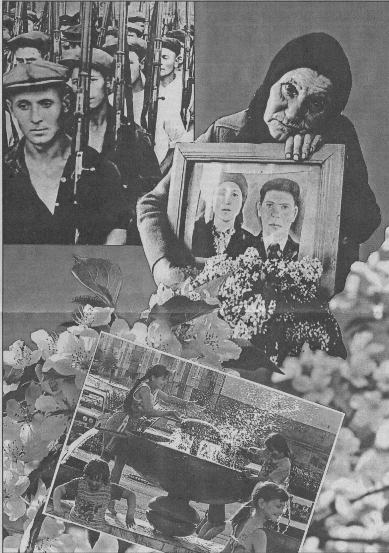
Коллаж Леонида БЕРЕЗНИЦКОГО.