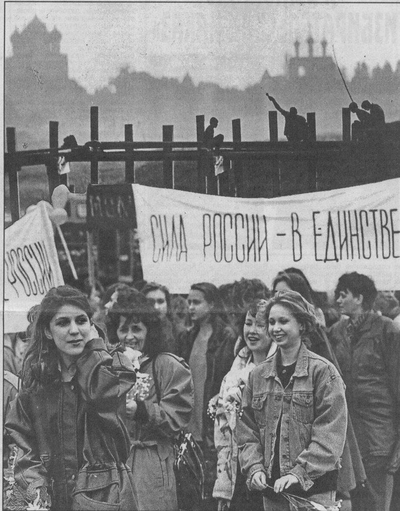
Коллаж Леонида БЕРЕЗНИЦКОГО.

За несколько дней, в ходе которых продолжалась операция по освобождению, погибли 130 мирных граждан, 18 работников милиции, 18 военнослужащих. Свыше 400 человек получили ранения различной степени тяжести.