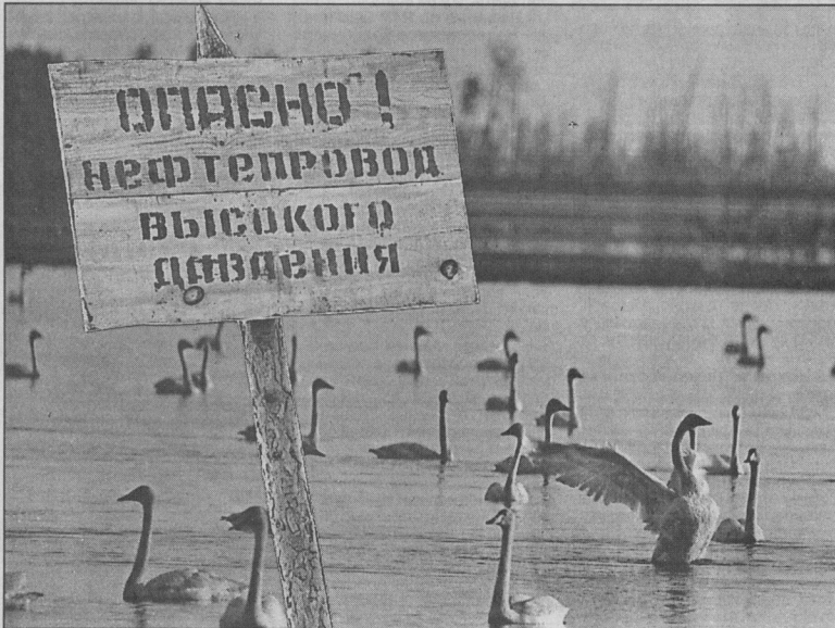
Коллаж Леонида БЕРЕЗНИЦКОГО.