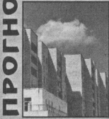
По сведениям Сургутского гидрометеобюро,

21 июля ночью и днем переменная облачность, без существенных осадков, ветер северо-восточный, 6-11 метров в секунду. Температура ночью +16,+18 градусов, днем +27,+29 градусов.