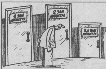
Рис. М. ЛАРИЧЕВА (г. Пушкин).

ны плюсом - конкуренцией между подрядчиками. Позвольте спросить, какая может быть конкуренция в нашем небольшом городе в системе муниципалитета? Может, Горэнерго будет конкурировать с Горводоканалом? Ведь эти предприятия - фактические монополисты. С кем же им конкурировать в городе, к тому же расценки, к примеру, на тепло, воду и свет тарифициро-