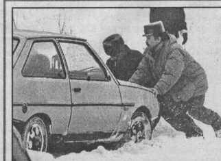
«Любиме кататься - любви и саночки возить».

Страницу подготовил Владимир ДОБРЫНИН.