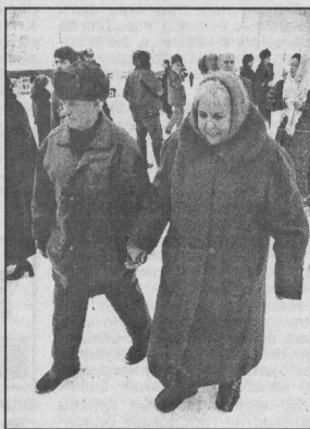
Окончание на 2-й стр.