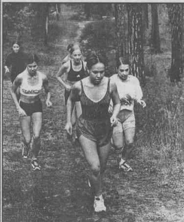
Как известно, в последнее время биатлон в Ханты-Мансийском округе стал неплохо развиваться.