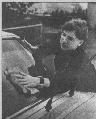
приходит вооруженные знаниями, как говорится, до зубов.

В РОСТО учат добротню, многие мастера производственного обучения работают здесь по 10-20 лет, действуют компетентный класс, вождению учат на специально новых машинах со «стажем» 1-2 года, причем ездят с учениками по всему городу. Случается, вместо полуженных 24 часов будущие водители накачивают 30-35, так что на экзамены они