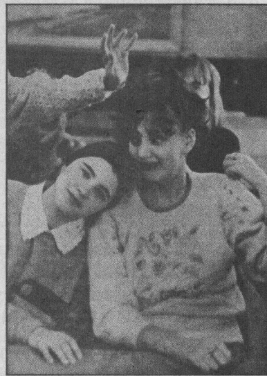
Наверное, у каждого свое понимание дружбы. Только как бы было здорово, если бы люди не старались извлекать из дружбы какую-то выгоду, а искали бы в ней что-то другое: теплое, человеческое...