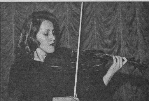
А через несколько месяцев коллектив вернется в свое отресторнованное здание с органом залом.