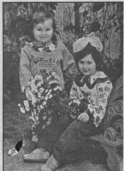
радость от нее - сегодня.

После споров пришли к решению: елка должна быть только настоящей, хоть и хлопот с ней больше. Но это - потом, зато