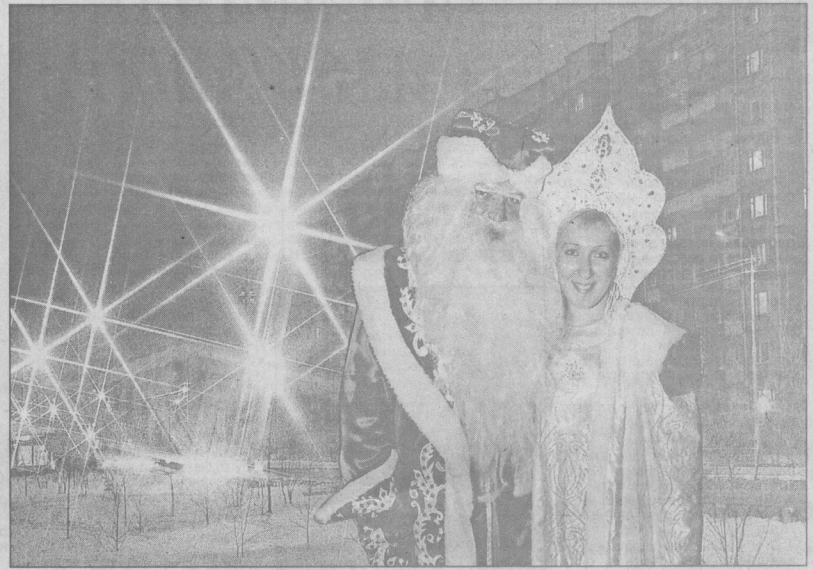
Коллаж Леонида БЕРЕЗНИЦКОГО.

"...У свежераненой большой запас прочности, жизненных сил и энергии, мудрости и оптимизма... Пусть в наступающем году вам сопутствует удача, а ваши дела принесут пользу России..."