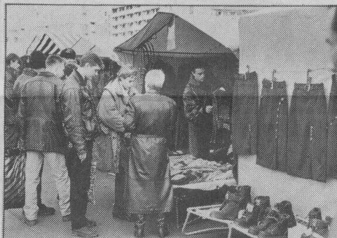
На снимках: после открытия нового рынка на старом вещевом по проспекту Набережному народу, возможно, поубавится.