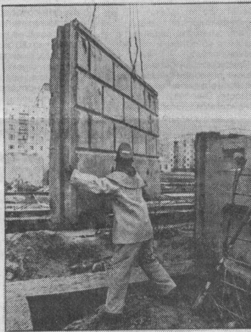
новостройка будет также "СТК" - компания, которой строить выгодно.

На днях решится вопрос об отводе земли под строительство второй очереди 24 микрорайона. Там вырастут дома наподобие этого, с квартирами для людей, желающих улучшить свои жилищные условия и имеющих на это средства. Заказчиком