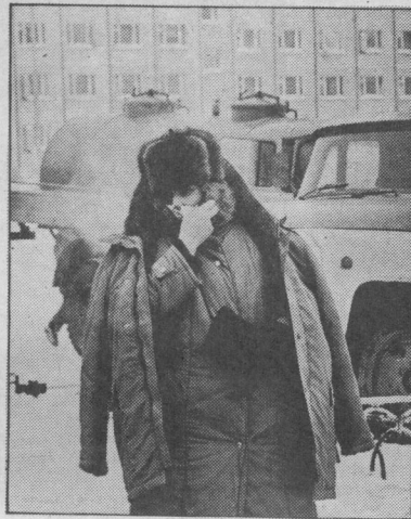
Минувшие выходные дни были крепко подпорчены ядреным морозцем.

Без нужды горожане старались не высовываться из дома. Ну, а понеделник стал дважды тяжелым - стужа достигла своего "пика". Воздух от холода стал белым, как молоко.