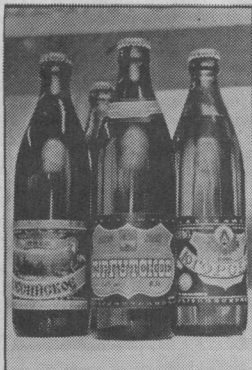
Сургутский пивоваренный завод отметил свое 15-летие.