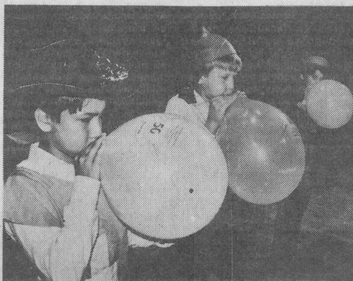
В ДК «Энергетик» был проведен детский конкурс «Рыцарь-95».

Рассмотрение вопросов о выплате единовременных пособий и оформлении необходимых документов возлагается на отдел по труду и миграции.