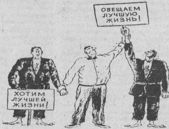
Рис. Н. КИНЧАРОВА.