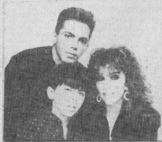
Фото из семейного архива звезды мексиканской эстрады Вероники Кастро, исполнившей главную роль в телесериале "Богатые тоже плачут", любезно предоставлено актрисой компании РИА-Фото: Вероника Кастро с сыновьями.