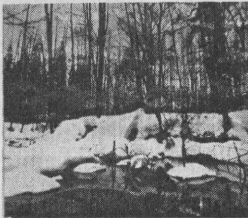
А ВОДЫ УЖ ВЕСНОЙ БЕГУТ.