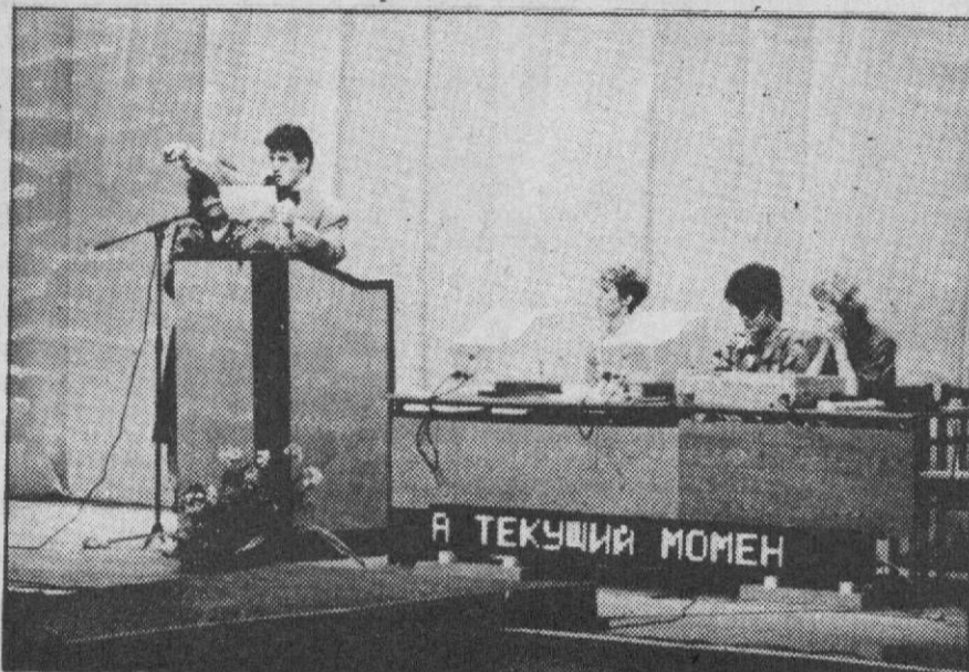
С ОЧЕРЕДНЫХ ТОРГОВ

Предложения по повестке дня до 17 марта нужно направлять по адресу: пр.Набережный, 16/1, комн.612. Контактные телефоны: 2-05-35, 2-29-70, 3-49-57, 3-38-84.