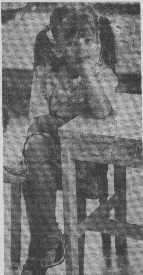
Вот и сентябрь. Малыши примеряют, присматриваются к новым одежкам, вдыхают запах портфелей. Рассматривают учебники с картинками. Все это на протяжении ближайших одиннадцати лет будет частью их жизни, основной частью. Они такие умные. Такие взрослые. Эти маленькие знайки...

У вашего ребенка легкое недомогание? Не спешите обращаться к врачу. Попробуйте народное средство, оно обязательно поможет.