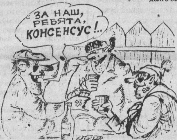
Рис. художника А. Васильева.

Конкурсная программа для женщин называлась "Хозяйшкa". Составить осенний букет и празднично оформить блюдо, сделать тематическую