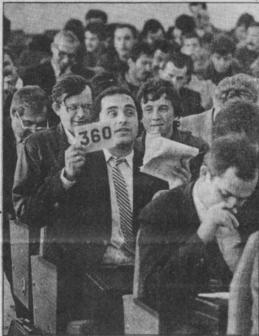
"ВАШЕ СЛОВО, ГОСПОДА БРОКЕРЫ!"

Теперь перед огородниками во весь рост встала другая проблема: где хранить второй хлеб? Овощехранилища имеют немногие.