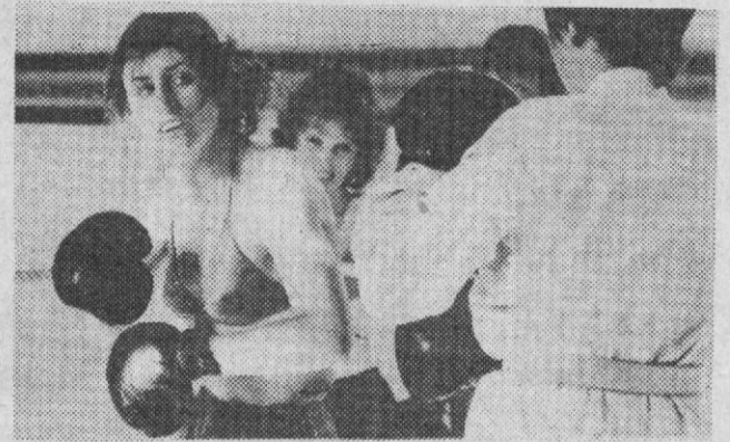
ДОГОНИМ И ПЕРЕГОНИМ ЗАПАД?

Грабители и нарушители покоя покушаются на чужое добро в разное время суток, независимо от сезона. Так, в этом году 12 раз звучал "СОС" из сур-