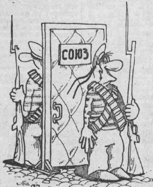
Рис. С. ФЕДЬКО.

Жители городка подводников (всего 32 подписи).