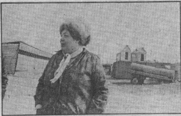
База УПТК домостроительных изделий для хозяйственных нужд на нулевом причале — настоящая кладовая для мужиков. Чего тут только нет: дверные и окон-

ные блоки, мастика и древесно-стружечная плита, облицовочный материал... Все это для дачника, к примеру, да и для рядового горожанина — желанный дефицит.