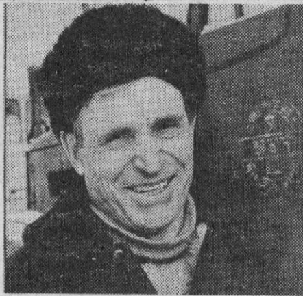
СНИМОК НА ПЕРВОЙ ПОЛОСЕ