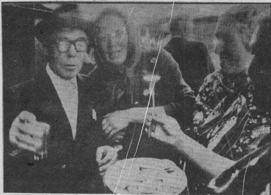
С ФЕСТИВАЛЯ "ОБЬ - 91"