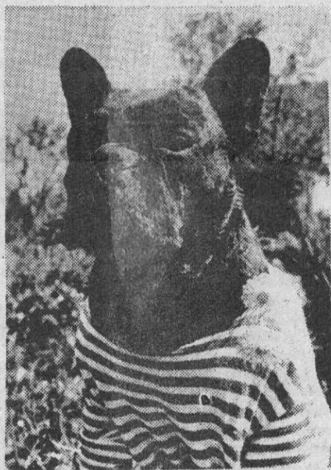
В.ЗАРУБИН. "БЫВАЛЫЙ". "СТАРИНА ПО-СОСЕДСТВУ".