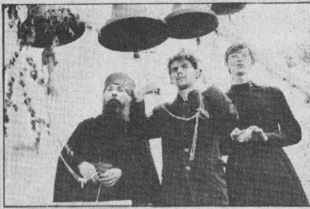
18 июня, с.ДЕМЬЯНСКОЕ.