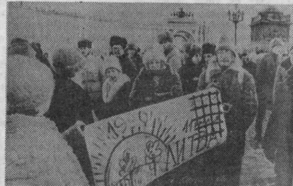
ЛЕНИНГРАД. МИТИНГ В ПОДДЕРЖКУ СУВЕРЕНИТЕТА ЛИТВЫ, ОРГАНИЗОВАННЫЙ ИНИЦИАТИВНОЙ ГРУППОЙ ЛЕНСОВЕТА, ПРОШЕЛ НА ДВОРЦОВОЙ ПЛОЩАДИ.

НА СНИМКЕ: ВО ВРЕМЯ МИТИНГА.