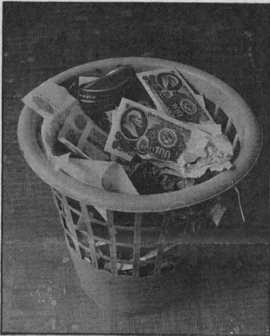
Событие номер один