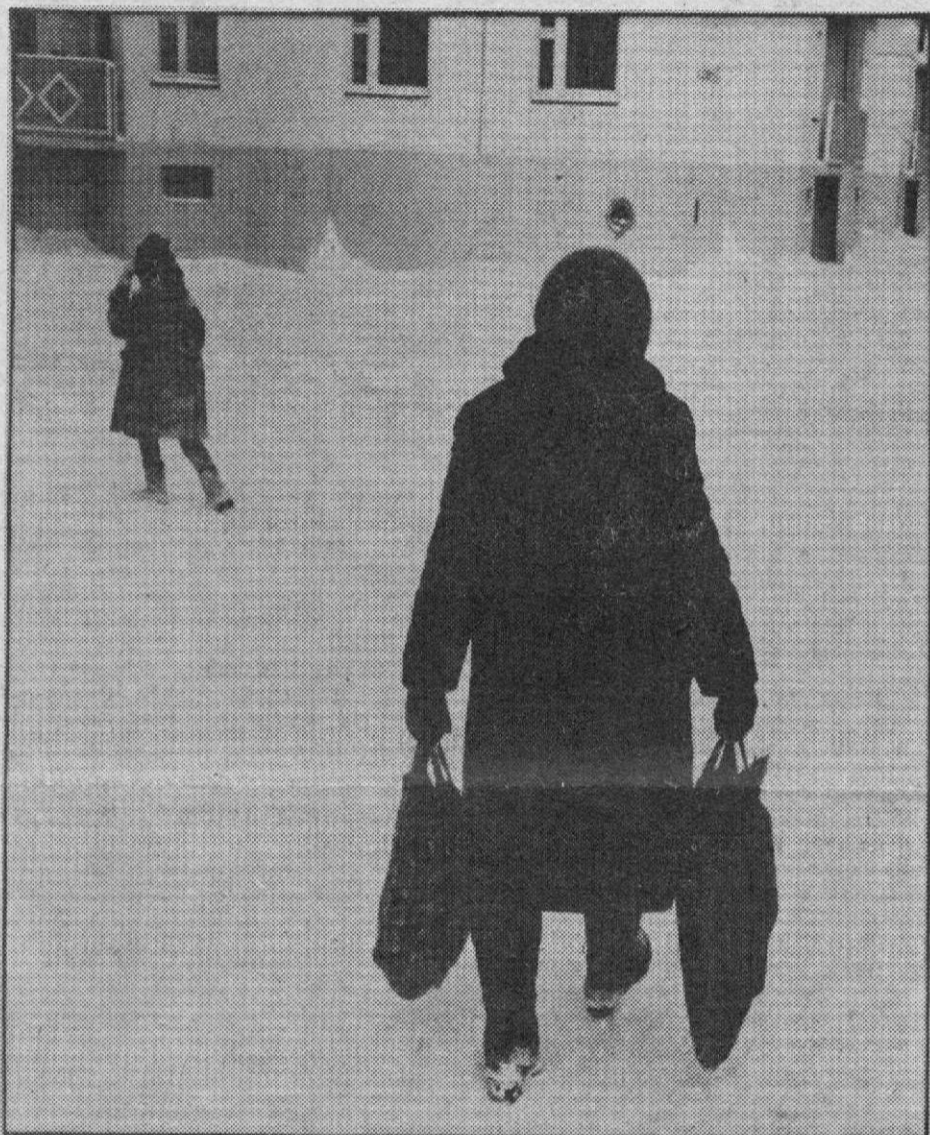
РЫНОК: КАК ВЫЖИТЬ?

Газета выходит с 23 октября 1934 года ★ № 34 (7103) ★ Четверг, 21 февраля 1991 года ★ Цена 1 экз. в подписку 6 коп., в розницу 10 коп.