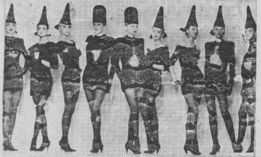
Вот что сегодня предлагают Дома моделей. Рискнем?

К 1 чайной ложке меда, подогретого до жидкой консистенции, прибавляется около 1 ложечки муки и белок 0,5 яйца, взбитый в пену. Полученная смесь наносится на лицо, через 20-30 минут смывается прохладной водой.