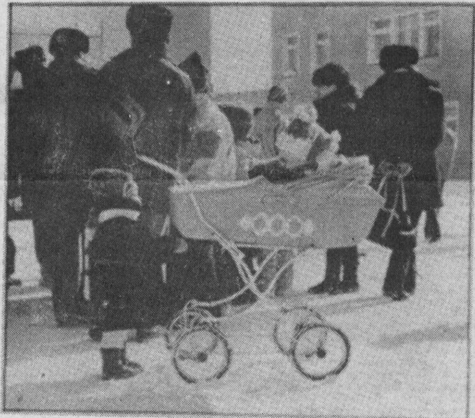
ПОКА Папы МИТИНГУЮТ.

Следует ли судить столь категорично? Семьдесят лет дипломатия и внешнеэкономическая деятельность были делом Центра. Москва определяла, чего и сколько надо Сургуту. И вот сделаны первые шаги для того, чтобы изменить ситуацию подотчетными нам избирателям, должностными лицами. Давайте отнесемся к ним с пониманием и не станем ждать, что после каждой поездки на наши головы посыплется манна небесная.