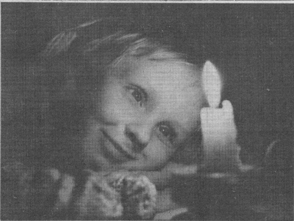
Снимок из читательского конверта. «ЗАМЕЧАЛАСЬ».

Цель нынешней Недели народной музыки, открывшейся в Сургутском музыкальном училище — напомнить историю русских народных инструментов, расширить круг их поклонников. Программа Недели насыщенная: концерт учащихся народного отделения училища, выступление известной домристки, артистки