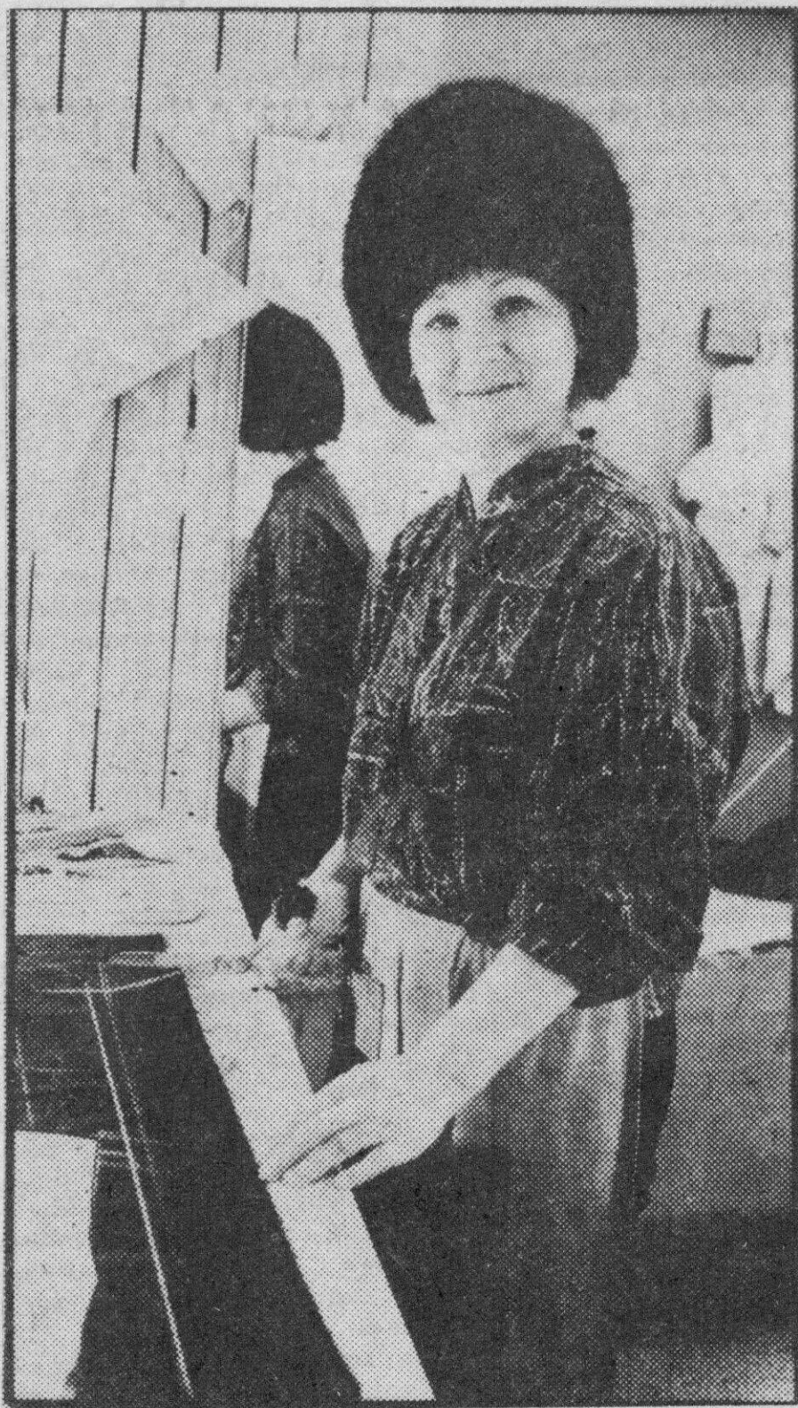
● КАК ВАС ОБСЛУЖИВАЮТ

котором насчитывается двести участков. У Сургутской ГРЭС-1 изъята на основании статьи 31, параграф 1, Земельного кодекса РСФСР участок площадью 12 гектаров, ранее отведенный садоводческому товариществу № 1 «Север». Земля передана в пользование кооперативу «Заречный».