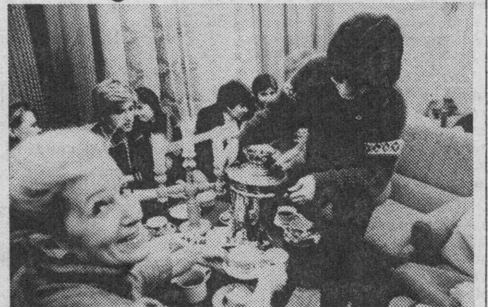
44 подростковых и молодежных клуба работают в Гагаринском районе Москвы. Среди них 16 многопрофильных, 11 спортивных, 3 технических, 11 эстетического профиля и 3 клуба-кафе.

Один из них — клуб «Гагаринец». Здесь открыты видеосалон, студия танца и пластики, фотокружок, кружок английского языка, депопроизводства, клуб молодой хозяйки, музыкальный клуб и другие.